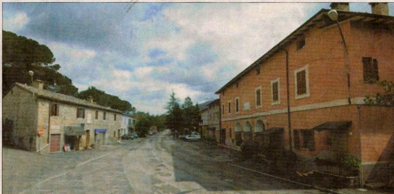
"Frammenti di storia" E' l'iniziativa di Colle Umberto, la mattina del 18 è prevista anche una messa

Interventi di ripulitura sulle due lapidi, si va verso la cerimonia