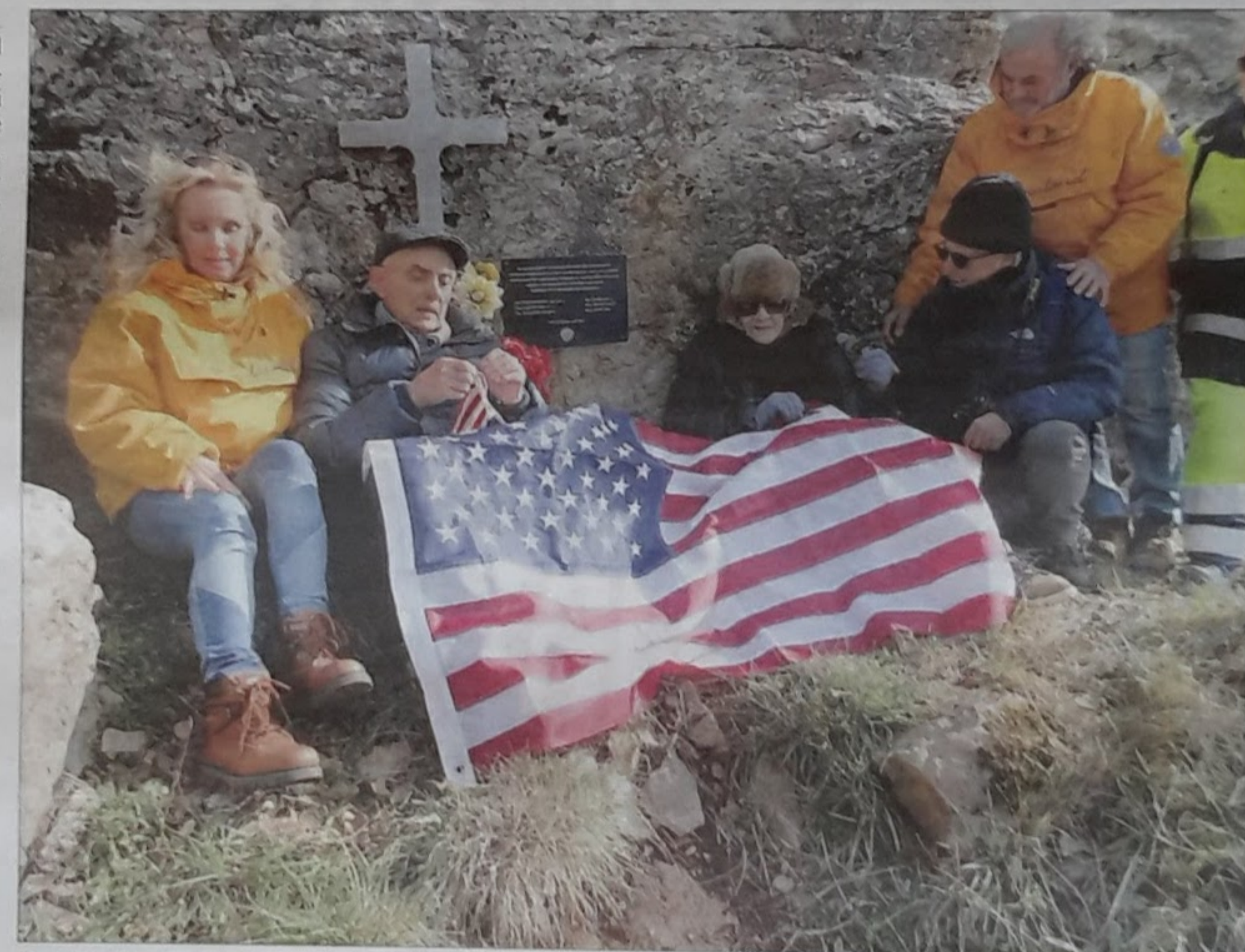
Una storia di guerra Lo schianto nel gennaio del 1944 sul Monte Tezio. Dopo più di 70 anni la ricognizione sul monte

Questi signori hanno cercato il parente vivente più prossimo di ogni defunto. L'unico